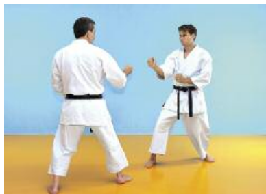
4 Beide Partner trennen sich synchron voneinander und stehen in Aihanmi.