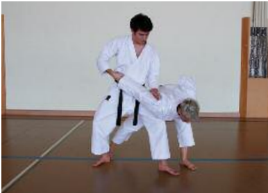
3. Arm hebeln und kontrollieren