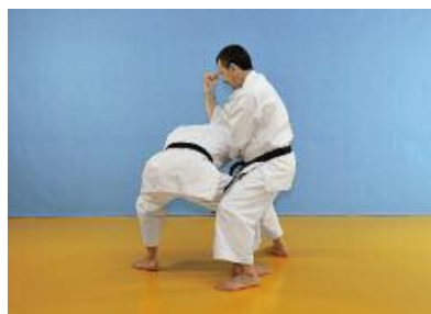
9 Otoshi Empi in den Nacken des Verteidigers ausführen.