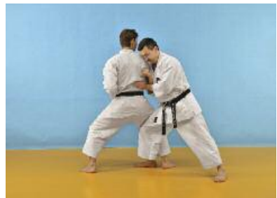
4 Nun gleitet der Verteidiger in Junzuki no Tsukomidachi zum Gegner und führt mit der rechten Hand einen Haito unterhalb des Schulterblatts aus. Die linke Hand greift mit einem Shutouchi die Nieren an.