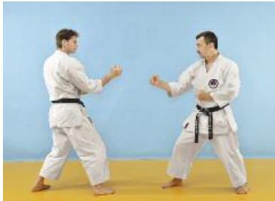
1 Angreifer Migi Hanmi Gamae / Verteidiger Migi Hanmi Gamae.