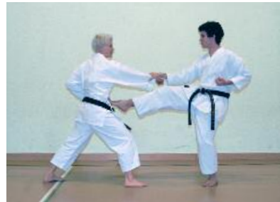
2. Maegeri Konter Vorderbein