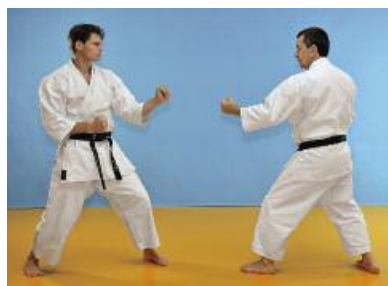
10 Beide Partner trennen sich synchron voneinander.