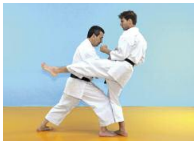
3 Der Angreifer zieht sein vorderes Bein an, um mit dem linken Bein mit Chudan Maegeri anzugreifen. Zeitgleich gleitet der Verteidiger in den Gegner hinein und führt mit dem ganzen Körpergewicht einen Urazuki (oder Tatezuki) mit Nakadaka Ipponken aus. Die linke Faust greift gleich-zeitig mit Nakadaka Ipponken auf das gegnerische Knie an. Mit dem rechten Knie wird das rechte Bein des Gegners kontrolliert.