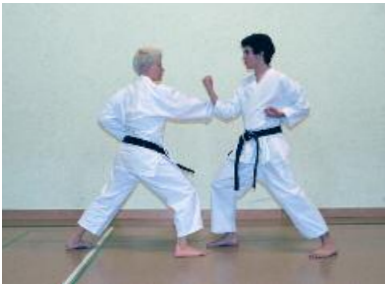
1. Chudanzuki vor

Ausgangsposition gleich wie 1. Übung (ohne Abbildung)