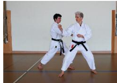
4. Konter Gyakuzuki