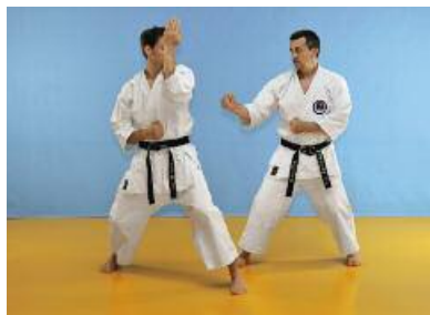
6 Den Angriff zurückziehen.