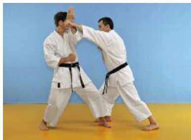
2 Der Angreifer gleitet seitlich vor und greift mit Jodan Gyakuzuki an. Der Verteidiger gleitet seinerseits leicht zurück und wehrt den Angriff mit Shuto Nagashiuke ab.