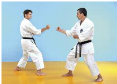
7 Beide Partner trennen sich synchron voneinander und stehen in Aihanmi (gleichseitige Beinstellung).