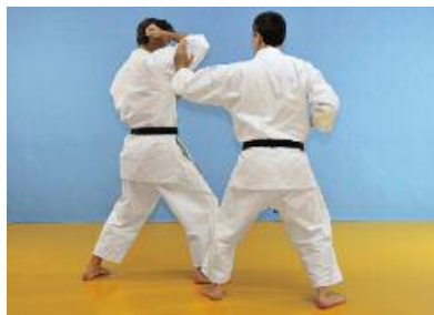
3 Der Angreifer kontrolliert mit der linken Hand den rechten Arm des Verteidigers.