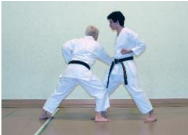
3. Arm nach unten ziehen