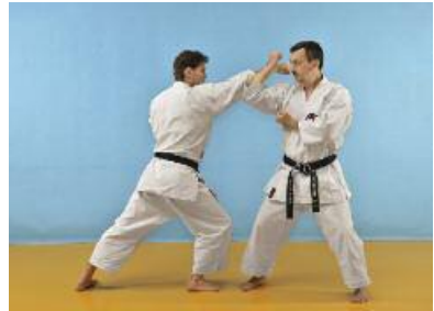
2 Der Angreifer gleitet mit Jodan Tobikomizuki vor. Der Verteidiger gleitet leicht zur Seite und führt einen Jodan Nagashiuke aus.