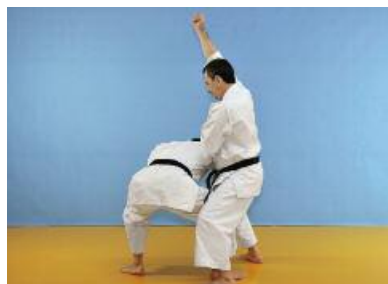
8 Der Angreifer stellt sein Bein wieder auf den Boden und führt zeit- gleich einen Otoshi Empi in den Nacken des Verteidigers aus (Bilder 8 und 9)