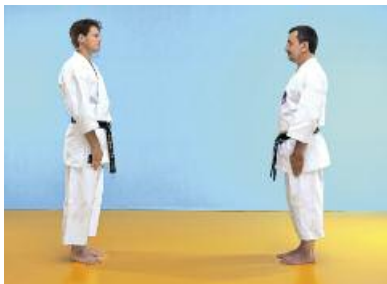
3 Musubidachi beibehalten.