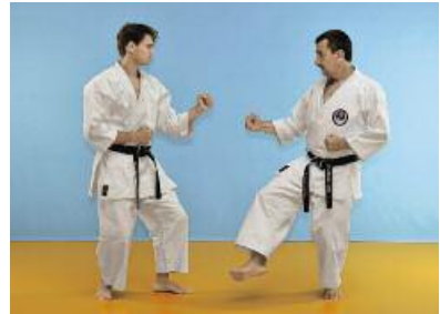
2 Der Angreifer zieht das hintere Bein leicht an und versucht mit dem vorderen Bein einen Ashibarai anzuwenden. Der Verteidiger weicht diesem Angriff aus, indem er einen Schritt zurückgeht.