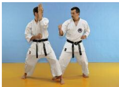
4 Danach führt der Angreifer einen Chudan Gyaguzuki aus.