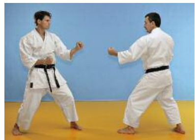
6 Beide Partner trennen sich synchron voneinander.