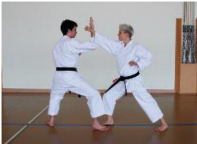
1. Angreifer vor Jodan Zuki

Angreifer links/Verteidiger links mit Gedanbarai Junzuki Jodan angreifen/ mit Shutouke abwehren kontern Schritt vor und Haltegriff - Uraken Ausgangsposition gleich wie 1. Übung (ohne Abbildung)