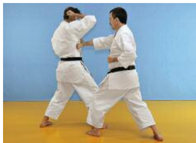
4 Der Angreifer führt einen Chudan Gyakuzuki aus.