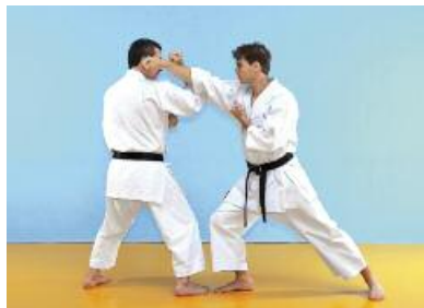
2 Der Angreifer gleitet mit Jodan Tobikomizuki vor. Der Verteidiger gleitet leicht zur Seite und führt einen Jodan Nagashiuke aus.