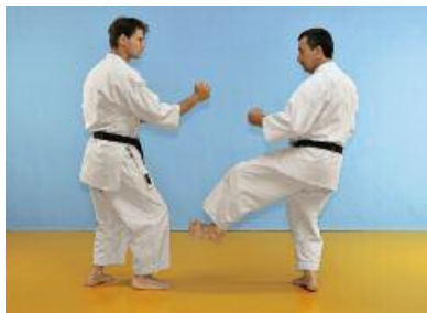
3 Nun wiederholt der Angreifer den Ashibarai und der Verteidiger weicht wieder mit einem Rückwärtsschritt aus.