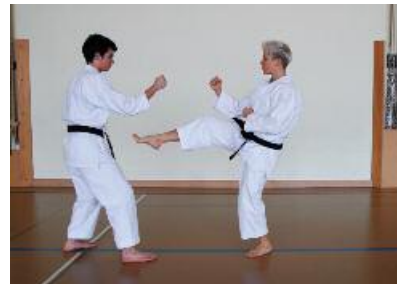
2. Maegeri - Zurückweichen