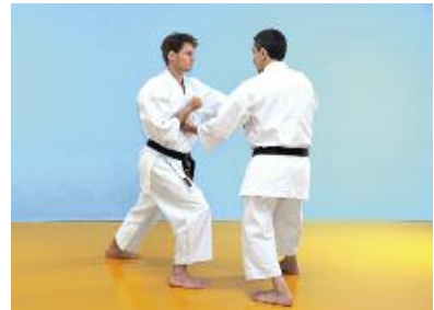
6 Der Angreifer führt einen Chudan Gyakuzuki aus. Der Verteidiger zieht seine rechte Hüfte zurück und lässt den Körper senkrecht. Zeitgleich führt er rechts einen Chudanbarai aus, während die linke Faust in Urazuki-Haltung einen Angriff auf den Solarplexus ausführt.