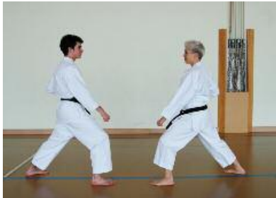
3. Zurück in die Ausgangsposition