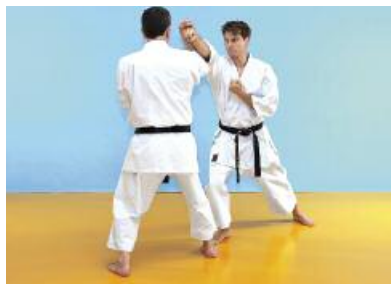
Gegenüberliegende Ansicht / Opposite view Bild 5 Der Angreifer gleitet mit Jodan Tobikomizuki vor. Der Verteidiger gleitet leicht zur Seite und führt einen Jodan Nagashiuke aus. Es ist wichtig, dass der Angriff nicht abgeblockt, sondern lediglich umgeleitet wird. Die Extremitäten spielen beim Kihon Kumite eine untergeordnete Rolle und dienen meistens nur zur Unterstützung.