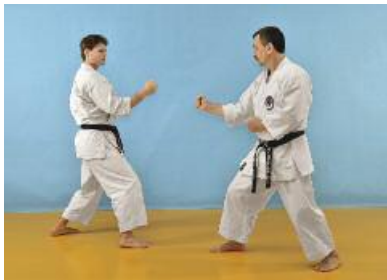
5 Beide Partner trennen sich synchron voneinander und stehen in Aihanmi.