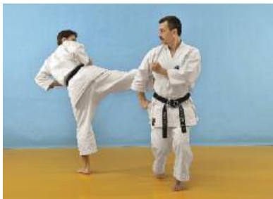
3 Der Angreifer zieht das linke Bein kurz an, um unmittelbar darauf mit dem vorderen Bein einen Chudan Sokutogeri auszuführen. Der Verteidiger verschiebt seinen Körper nach links und wehrt mit einem Gedan Nagashiuke ab. Die Position ist Gyaku Nekoashidachi. Hierbei ruht das Gewicht gleichmäßig auf beiden Beinen, und der Oberkörper bleibt senkrecht.