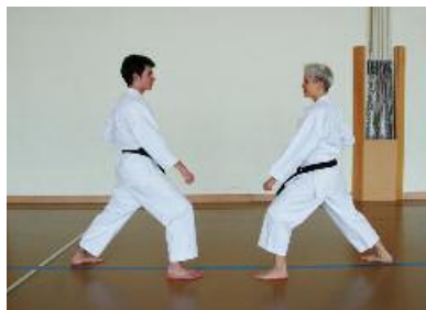
5. Zurück in die Ausgangsposition