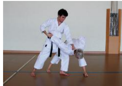
4. Uraken ausführen