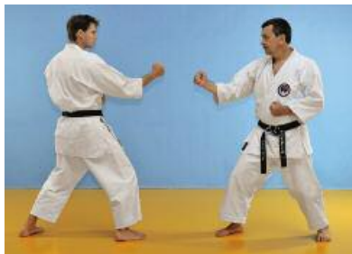
1 Angreifer Hidari Hanmi Gamae / Verteidiger Migi Hanmi Gamae.