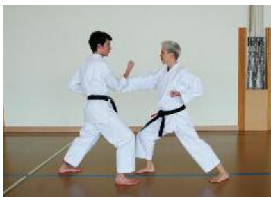
1. Angreifer Chudanzuki

Chudan Uchi Uke abwehren, kontern mit Gyakuzuki