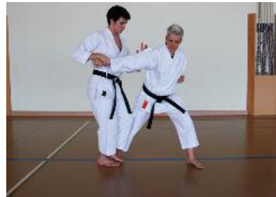
2. Arm fassen, vorwärts laufen