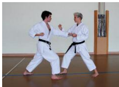
2. Chudanzuki - Uchiuke Konter Gyakuzuki