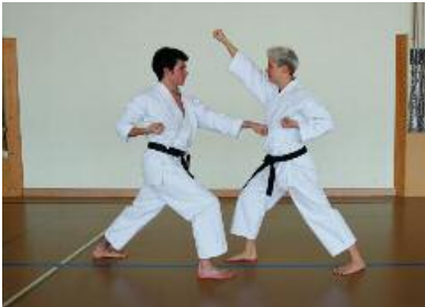
3. Jodanzuki - Jodanuke