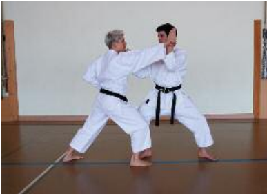
von der anderen Seite