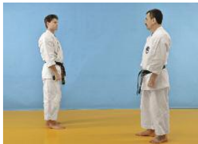
8 Ausgangsposition einnehmen.