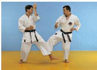
3 Der Angreifer führt mit dem linken Bein einen Ashibarai aus und kontert unmittelbar danach mit Chudan Gyakuzuki (Bild 4 und 5).