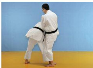
7 Der Angreifer zieht den Verteidiger nach unten und greift gleichzeitig mit einem Hizageri den Solarplexus an.