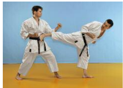
4 Der Angreifer stellt das vordere Bein ab, dreht seinen Körper und greift mit Chudan Ushirogeri an.