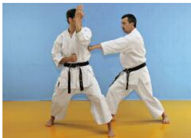
5 Danach führt der Angreifer einen Chudan Gyaguzuki aus.