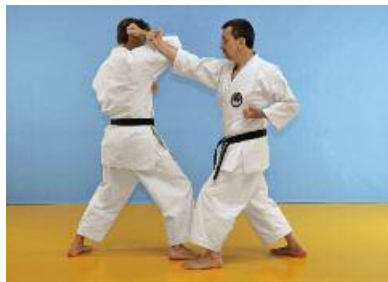
2 Der Verteidiger geht links vor und greift rechts mit Jodan Gyagu Uraken an. Der Verteidiger blockt den Angriff ab, indem er den rechten Arm zum Kopf hochzieht.