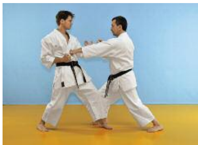
5 Der Angreifer dreht seinen Körper nach vorne und führt zeitgleich einen Chudan Gyakuzuki aus.