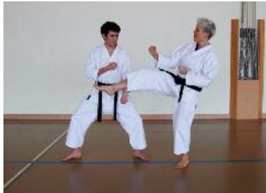
3. Maegeri - Suki Uke Abwehr