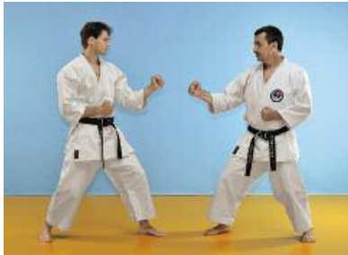
1 Angreifer Hidari Hanmi Gamae / Verteidiger Migi Hanmi Gamae.