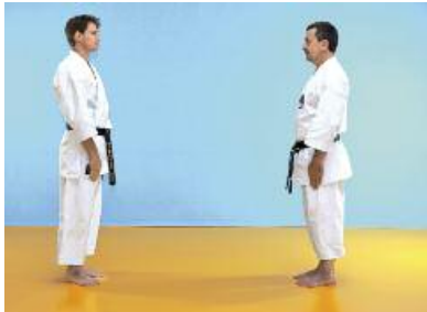
1 In Musubidachi einander gegenüber stehen. Die Schultern sind entspannt.