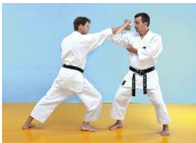
5 Der Angreifer gleitet mit einem Jodan Tobikomizuki vor. Der Verteidiger gleitet leicht zur Seite und führt einen Jodan Nagashiuke aus. Es ist wichtig, dass der Angriff nicht abgeblockt, sondern lediglich umgelenkt wird. Die Extremitäten spielen beim Kihon Kumite eine untergeordnete Rolle und dienen meistens nur zur Unterstützung.