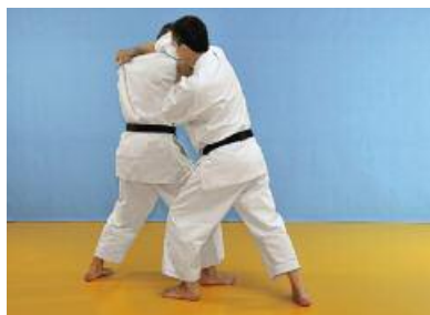
6 Der Angreifer fasst die linke Schulter des Verteidigers.