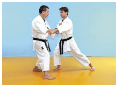
Bild 6 Der Angreifer führt einen Chudan Gyakuzuki aus. Der Verteidiger zieht seine rechte Hüfte zurück und lässt den Körper senkrecht. Zeitgleich führt er rechts einen Chudanbarai aus, während die linke Faust in Urazuki-Haltung einen Angriff auf den Solarplexus ausführt.