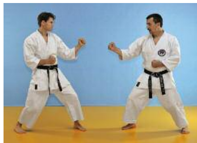
1 Angreifer Migi Hanmi Gamae / Verteidiger Hidar Hanmi Gamae.